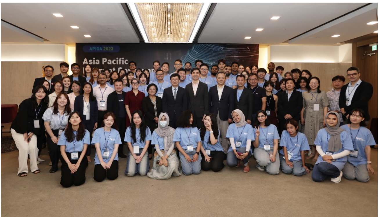
圖四、全體學員與導師合影

這五天的研習營為我們提供了一個寶貴的學習和交流機會，讓我們更深入地了解了網路治理的複雜性和重要性。我相信這次的經驗將成為我未來在網路治理領域持續學習和參與的動力，並為改善全球網路環境做出積極的貢獻。