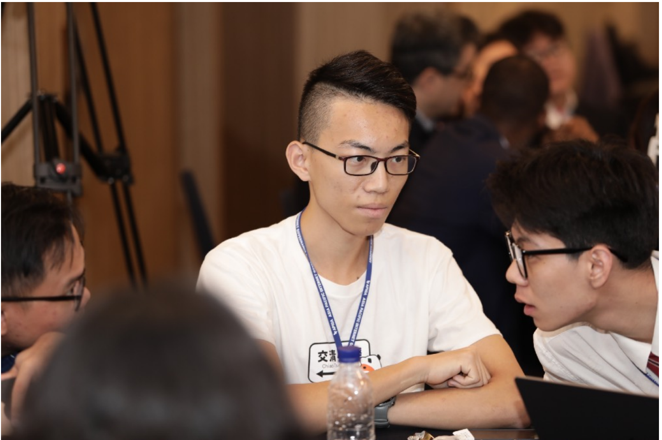
圖三、透過小組討論凝聚共識

我參與了公關小組，這次的角色讓我深刻體會到在危機情況下，公關如何平衡溝通、外部形象和資訊安全之間的關係。在模擬過程中，我們經常需要在各個部門之間協調，以確保在處理資安事件時能夠保持一致和透明的溝通。